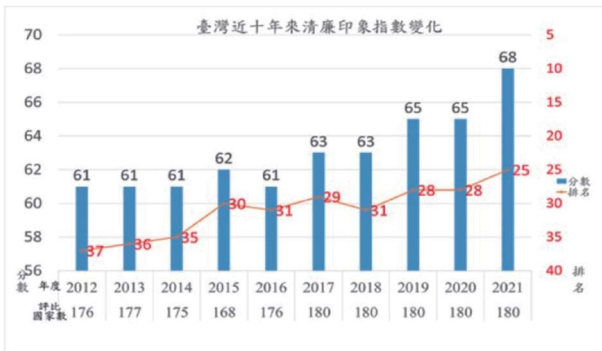
我國近十年清廉印象指數變化。

近年來，本局秉持「貼心辦稅，真誠服務」、「簡政便民，智慧服務」的理念，推出「不動產移轉網實整合服務」，簡化不動產移轉申辦流程，民眾於稅務局「一處送件，全程服務」，即可在地政辦理移轉過戶，減少民眾來回奔波，深獲好評；本局將持續推動各項為民服務及行政透明措施，提升各界對政府行政效率及清廉程度之正面評價。